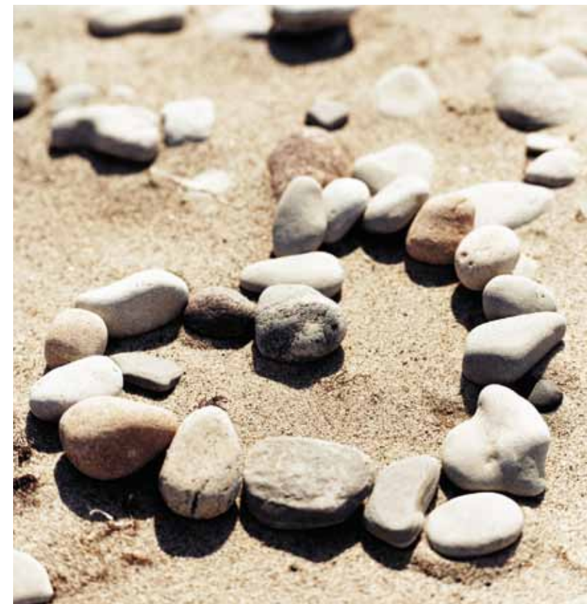
3. UDGAVE, 1. OPLAG, 2009. PRODUKTION: DATAGRAF. BESTILLINGSNR. 209

Dit netværk på vejen til ny livskvalitet